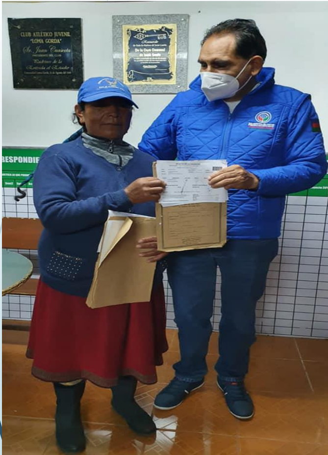
BRIGADAS SE ASESORÍA JURÍDICA ENTREGA DE LAS ESCRITURAS INSCRITAS EN LA COMUNIDAD LOMA GORDA

Implementar mecanismos de acercamiento del Registro a los usuarios y otras partes interesadas del Cantón Pedro Moncayo