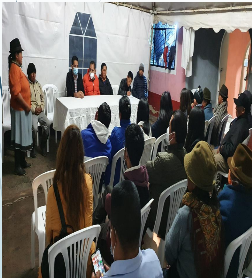
BRIGADAS SE ASESORÍA JURÍDICA COMUNIDAD CAJAS JURÍDICA EN LA PARROQUIA DE TUPIGACHI

Implementar mecanismos de acercamiento del Registro a los usuarios y otras partes interesadas del Cantón Pedro Moncayo