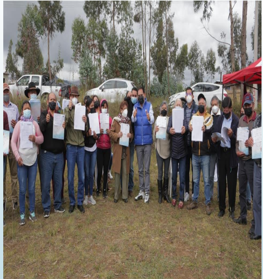
BRIGADAS SE ASESORÍA JURÍDICA ENTREGA DE LAS ESCRITURAS INSCRITAS A LA COOPERATIVA DE VIVIENDA TABACUNDO MODERNO